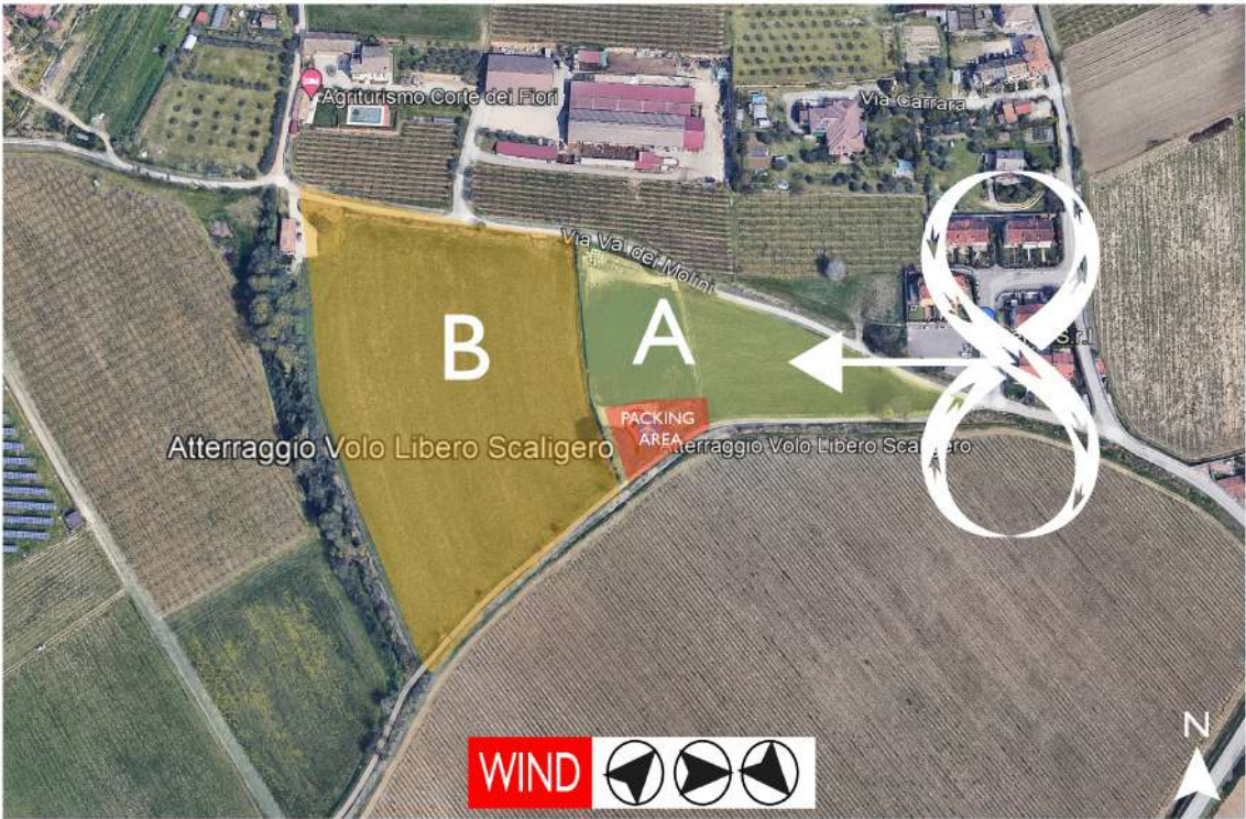
Finale di atterraggio / Figure 8 landing approach